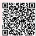
花蓮縣 文化局圖書館 【潤潤閱讀】