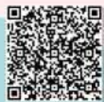
閱讀幼苗講座 及繪本分享影片