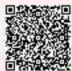
花蓮縣 公共圖書館簡介